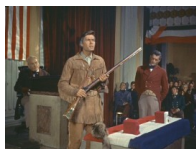
Fotograma de Davy Crockett, héroe de la batalla del Alamo.

Corría el año 1740 y el este de los Estados Unidos ya estaba poblado, hombre duros que se adentraron en los bosques, unos buscando la libertad que en otro lugar no era posible, otros un medio de vida. De cualquier forma todos tenían algo en común. En los densos bosques de Kentucky, Indiana o Tennessee no se podía sobrevivir si no se iba acompañado de un buen rifle y el mejor era un rifle largo de Kentucky.