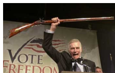
El actor Charlton Heston alzando un rifle de Kentucky en una convención de la N.R.A. de la que fue presidente hasta el año 2003