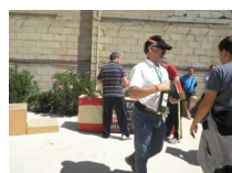
A GUARDAR PREMIOS