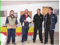
Repres. Tres Clubes