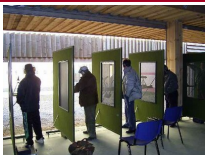
Galería 25 metros

En la segunda semana de Mayo se celebró en el Centro de Alto Rendimiento de Las Gabias (Granada) el Campeonato de España en las modalidades de Pistola Libre y Carabina Tendido. A este evento se desplazaron cinco tiradores de nuestro Club, 2 participaron en Pistola Libre y 3 en Carabina tendido.